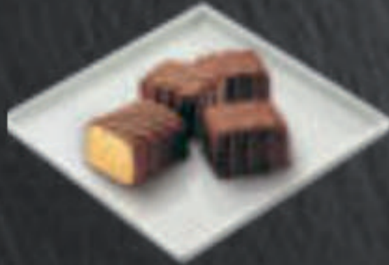
Bandeja de Bombones 6,50 €