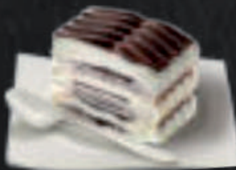
Tarta Carolina de Nata 7,75 €