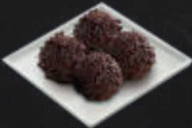
Trufas 7,50 €