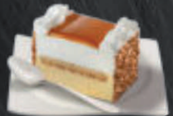
Tarta Gourmet al Whisky 7,75 €