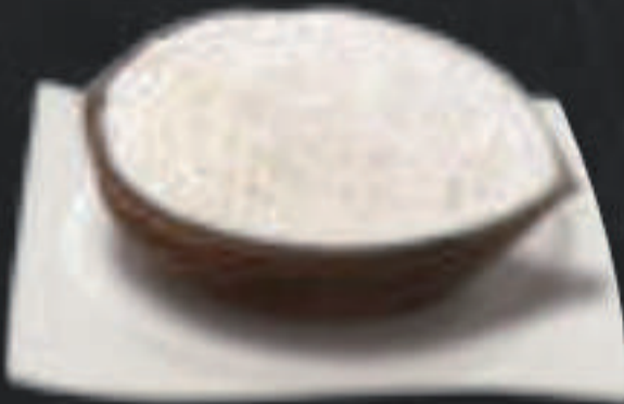
Coco Helado 6,50 €