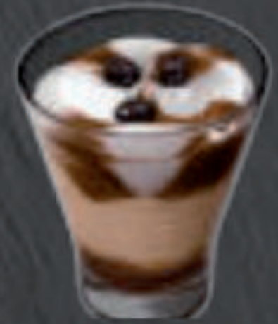
La Tentazioni Caffé 6,50 €