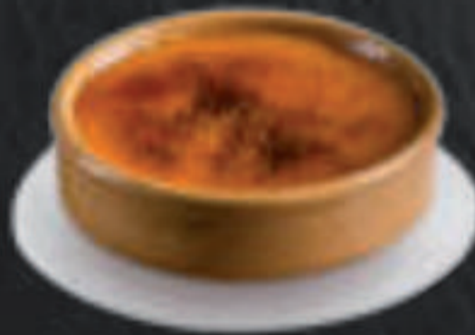
Crema Quemada 6,50 €