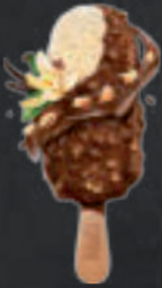
Nestlé Almendrado 4,50 €