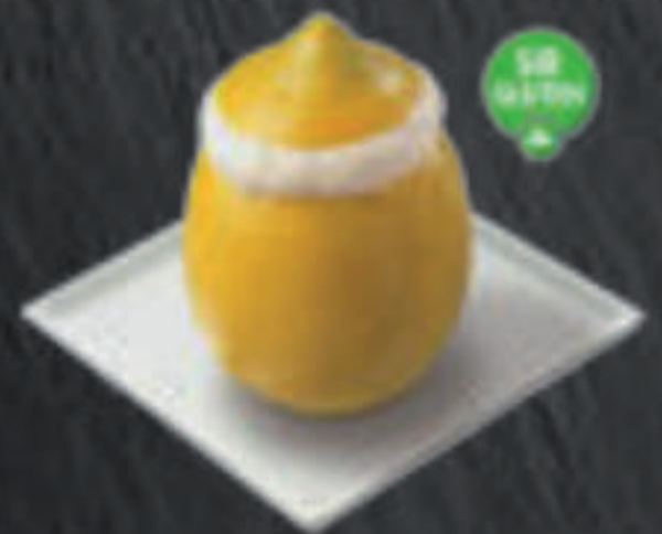
Limón Helado 6,50 €